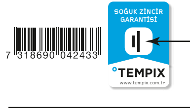
ŞEKİL - 1 SOĞUK ZİNCİR KIRILMAMIŞTIR

Ürün doğru sıcaklıkta tutulmamışsa belirlenen sıcaklığın üzerinde bir sıcaklığa maruz kalmışsa, soğuk zincir indikatör etiketindeki mavi pencere içerisinde bulunan siyah çizgiler beyazlaşarak barkodun son rakamları üzerine dağılacak ve mavi pencere içerisinde kontrol çizgileri bulunmayacaktır. Şekil-2' de görüldüğü gibi Mavi pencere içerisindeki siyah kontrol çizgilerinin beyazlaşması ve mavi pencere içerisinde siyah kontrol çizgilerinin olmaması ürünün taşınma esnasında belirlenen sıcaklığın dışına çıktığını soğuk zincirin kırıldığını gösterir. Bu indikatör etiketi +2C / +8C arasında taşınması gerekli ürünler için kullanılır.