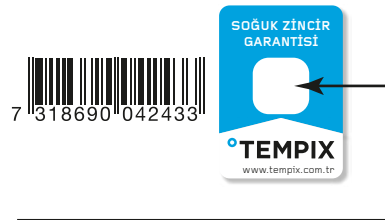
ŞEKİL - 2 SOĞUK ZİNCİR KIRILMIŞTIR